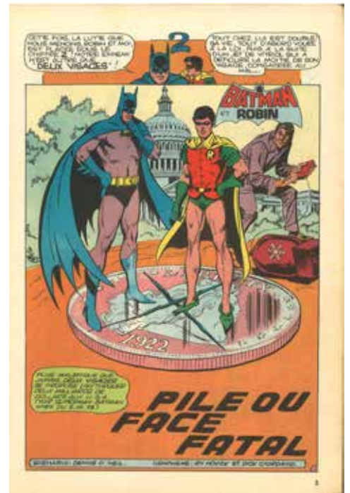
Batman © 1976 National Periodical Publication