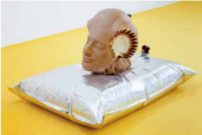
Saint-Jacques, série bivalve et monocouche, © Richard Fauguet