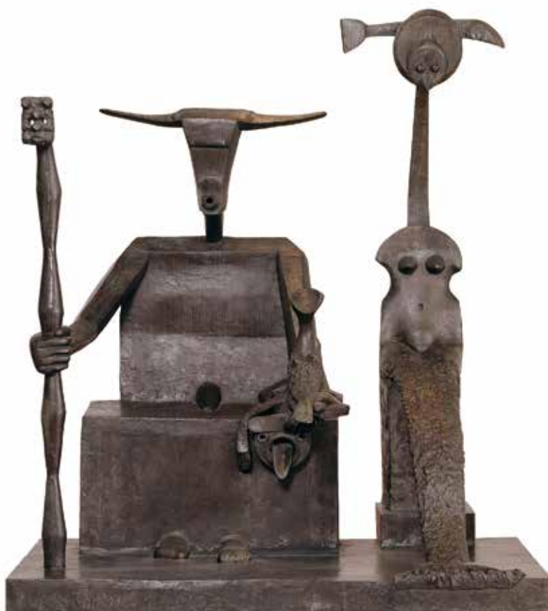
Capricorne, Max Ernst, (C) ADAGP, Paris, 2019 - Centre Pompidou, MNAM-CCI, Dist. RMN-Grand Palais Philippe Migeat

« Constellation Capricorne » s'inscrit dans ce sillage. Après les expositions « Max Ernst en Touraine, de rencontres en créations » (2016) et « Rabelais, un humanisme dévoilé » (2017), l'écomusée, dans le sillage des penseurs humanistes, réaffirme aujourd'hui son choix de mettre en avant ces passeurs de culture, humbles, curieux et engagés. Donner la parole aux artistes et aux citoyens curieux du monde qui les entoure est la fonction d'un musée vivant.