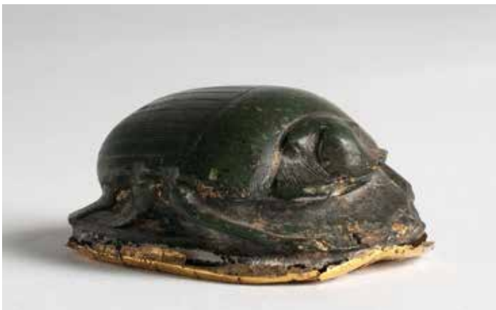
Amulette scarabée