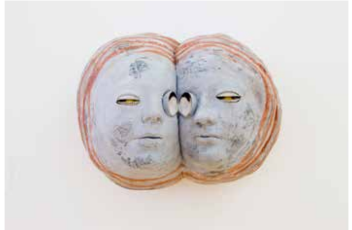
Simoises, série bivalve et monocouche, © Richard Fauguet