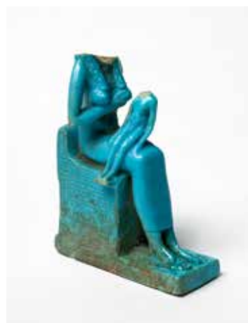
Amulette d'Isis allaitant son fils Horus