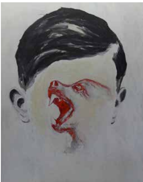
Voyage d'un animal sans mesure, Edi Dubien